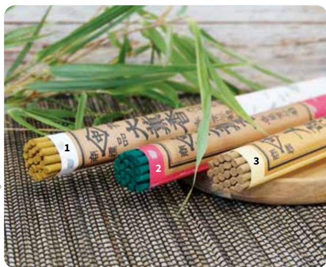
Dekoration im Lieferumfang nicht enthalten.