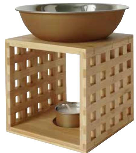
LEWI bronze (Abb.)

bronze W90334 bordeaux W90314 olive W90324 edelstahl W90344