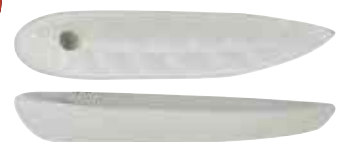
Räucherstäbchenhalter verkleinerte Abb.

Jede Packung inklusive einem Räucherstäbchenhalter aus Keramik!