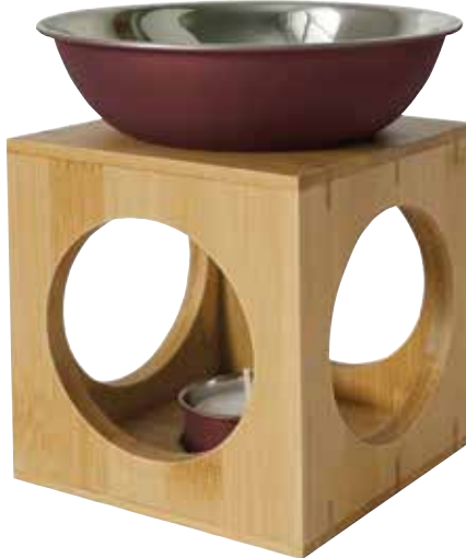
LIVINA bordeaux (Abb.)

edelstahl W90341 bordeaux W90311 olive W90321 bronze W90331