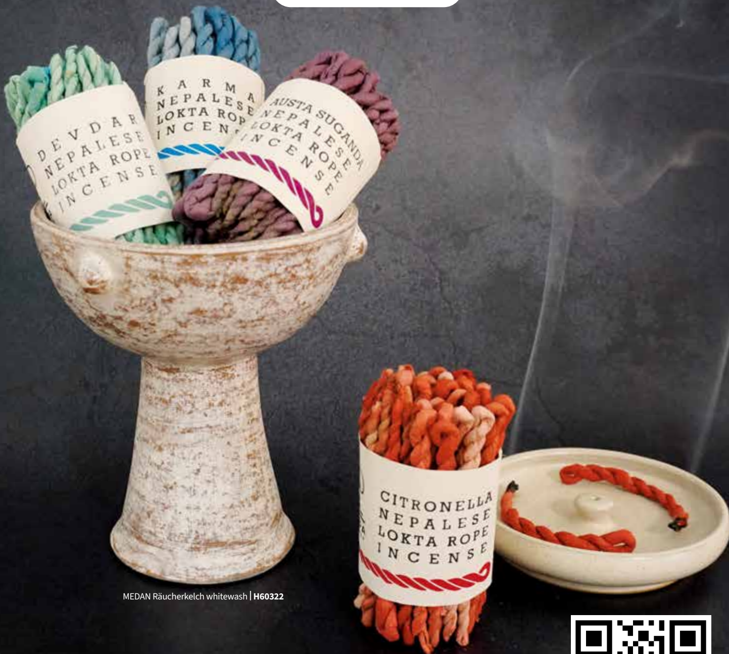
MEDAN Räucherkelch whitewash | H60322

Ein wichtiger Hinweis von unserer Seite! Aufgrund der wirtschaftlichen Situation können sich unsere Preise täglich ändern! Deshalb sind die in der Preisliste angegebenen Beträge Richtpreise. Notwendige Preisänderungen werden auch ohne Neuerscheinung einer neuen Preisliste weitergegeben und tagesaktuell in unserem Onlineshop unter www.bitto-shop.at veröffentlicht.