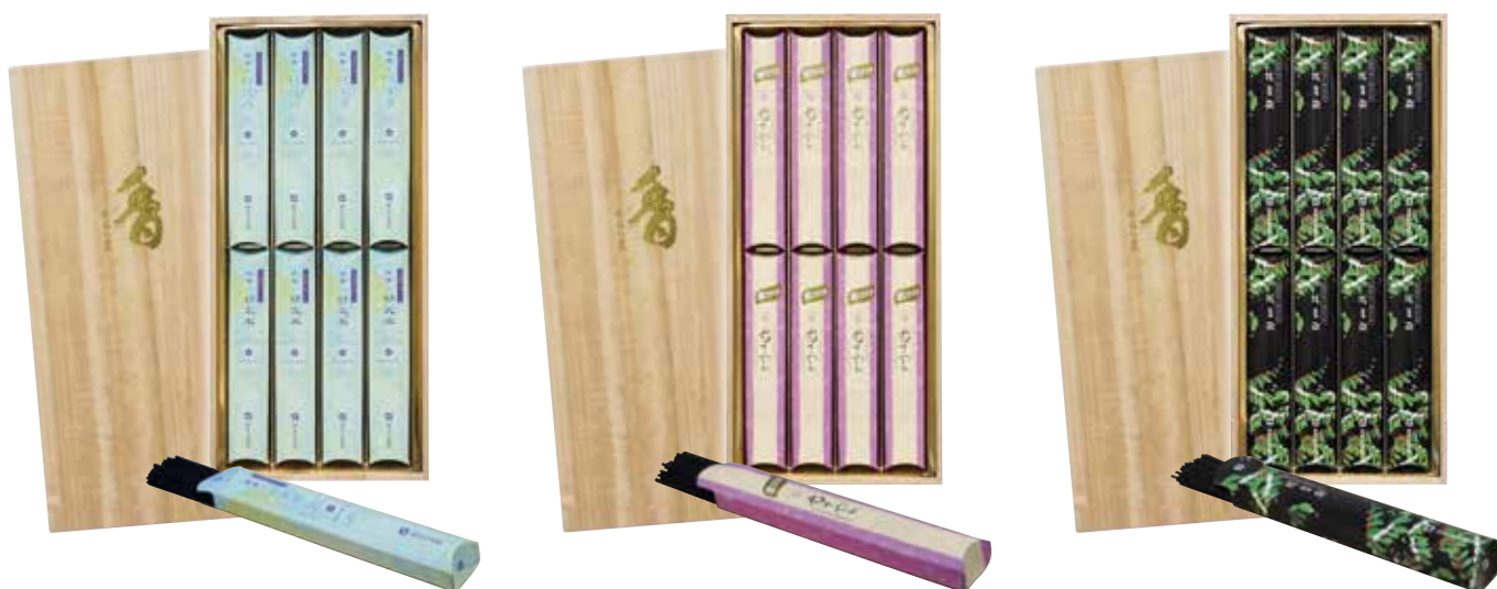
KOBUNBOKU BOX | 400634 Räucherschale MINI | G05280

Jede Geschenkbox enthält: 8 Schachteln zu je 50 Stäbchen, Länge je ca. 13,5 cm, Brenndauer je ca. 30 Minuten