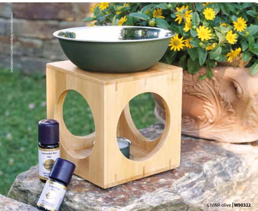
LIVINA olive | W90322

olive W90323 bordeaux W90313 bronze W90333 edelstahl W90343