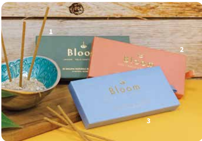
Dekoration im Lieferumfang nicht enthalten.

Sweet Sand lässt uns an einen Spaziergang auf einer Insel denken. Genießen Sie einen zeitlosen, exotischen Moment, während Ihre Haut von einer warmen, blumigen Brise zärtlich gestreichelt wird. | 450030