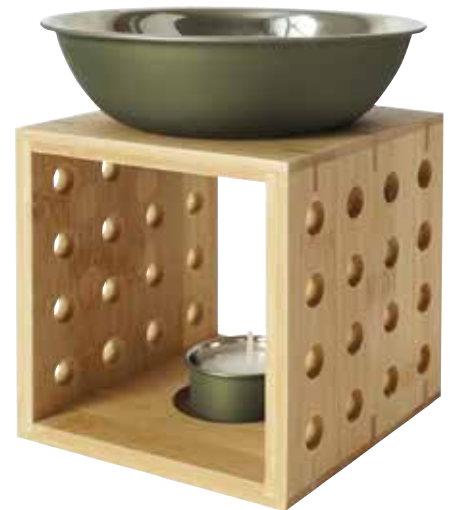
ELINE olive (Abb.)

bordeaux W90312 olive W90322 bronze W90332 edelstahl W90342