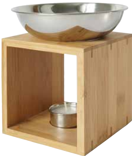
JARNE edelstahl (Abb.)

Korpus aus edlem Bambusholz L 11,5 cm, B 11,5 cm, H 15 cm, einer Schale Ø 14 cm, H 4 cm und einem Teelichthalter Ø 4,5 cm, H 2 cm, ohne Teelicht!