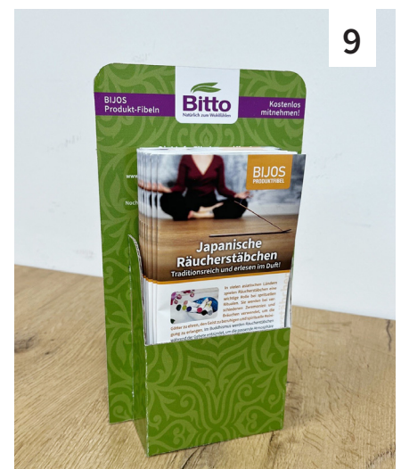
Abb. 7: Die kleinen Laschen auf beiden Seiten nach innen umklappen ... fertig! Jetzt mit den Foldern befüllen. Es passen in etwa 20 Folder oder mehr (je nach Seitenumfang des Folders) hinein.