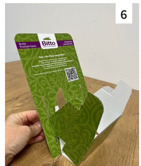
... bis der unbedruckte Teil vorne sichtbar wird. Abb. 6: Nun den unteren Teil (mit der farbigen Fläche außen bzw. vorne) nach oben klappen und die Seitenlaschen in die dafür vorgesehenen Schlitze stecken.