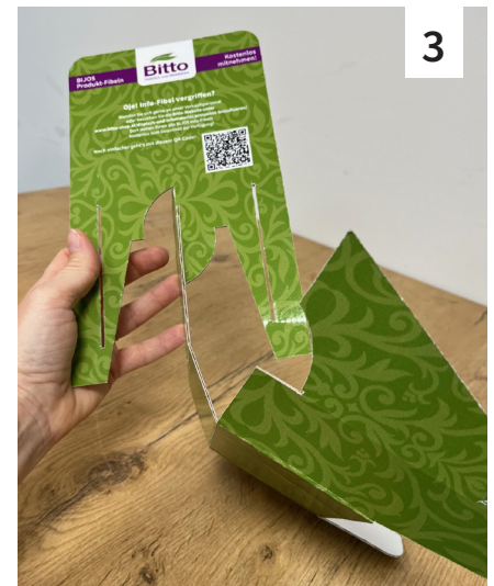
Abb. 1 bis 5: Den unteren Teil des Dispensers vorsichtig um 180° drehen ... Abb. 4 Kreis: Das „Drehgelenk“ um das der untere Teil gedreht wird ...